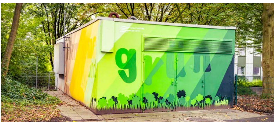
Eine neu gestaltete Übergabestation für Fernwärme im Erkrather Stadtgebiet.

Um den eng gesteckten Zeitplan der Bundesregierung einhalten zu können, müssen wir ohne den kommunalen Wärmeplan in Vorleistung gehen. Es liegt jedoch auf der Hand, dass die Dekarbonisierung der Fernwärme ein Hauptbestandteil der kommunalen Wärmeplanung ist.