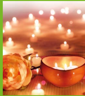
Foto Kerzen: pxhere.com; Illustration Wassertropfen: iStock.com – designer29

Es gelten die normalen Öffnungszeiten von 8 bis 20 Uhr. Weitere Infos unter: www.neanderbad.de